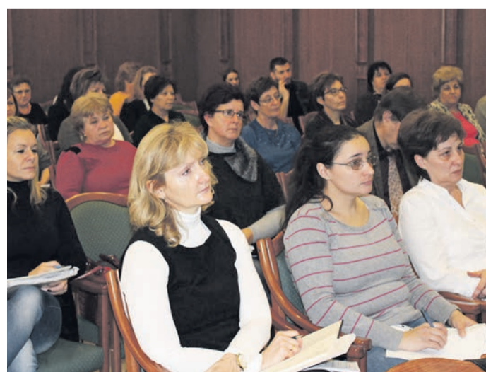
A szakképzési hozzájárulás kérdéseiről volt szó a kamarai tájékoztatón

Szót arról is, hogy a képzőhelyek gyakorlati oktatói mester-vizsgát vagy kamarai gyakorlati oktatói vizsgát tehetnek. A változást 2019. szeptemberében vezetik be. Magyarországon több mint 400 hivatást lehet elsajátítani, de csak 74 esetében lehet-