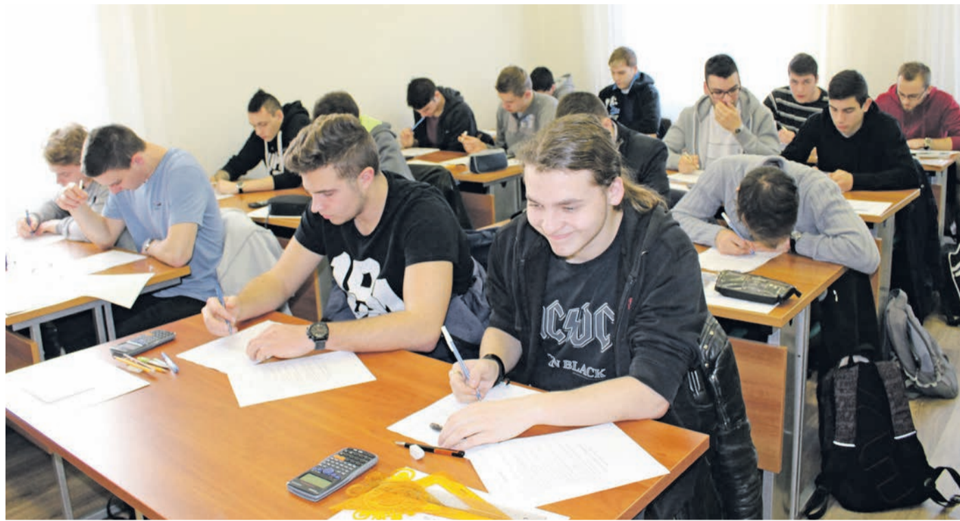
A mechanikus technikusok írásbelije

OKTATÁS Változások a tanulószereződéses rendszerben