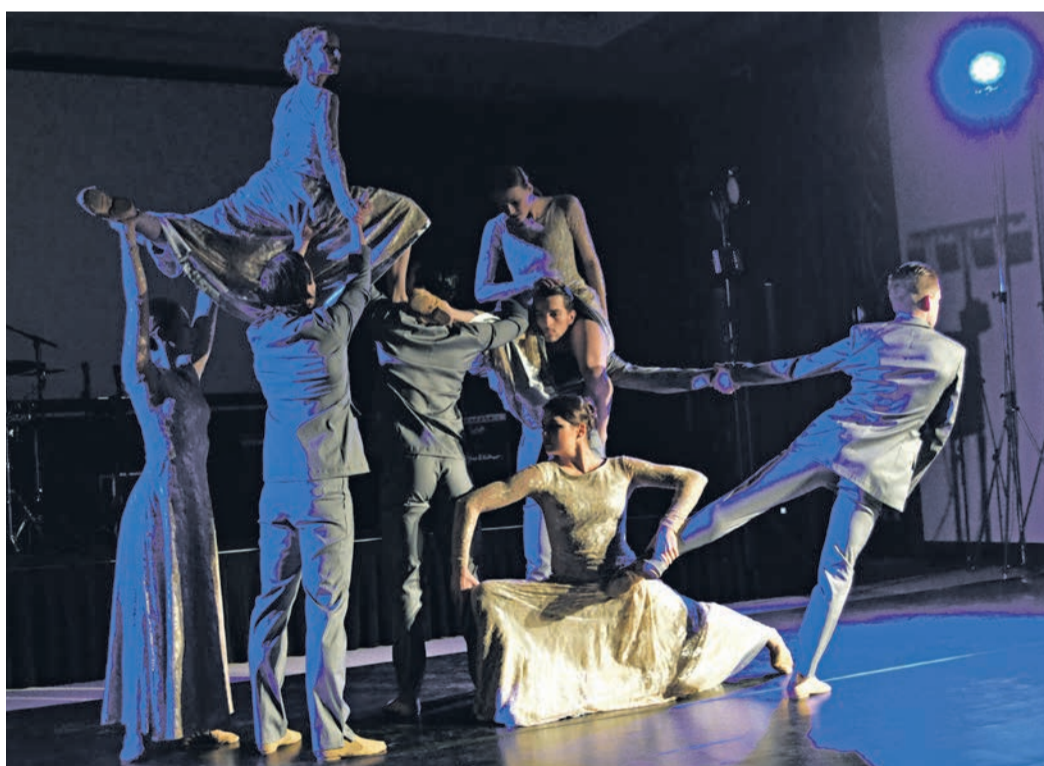
A Kecskeméti City Balett nyitótáncát láthatta a közönség

a mások is mi vagyunk.” Egy közösség tagjaiként meg kell tudnunk érteni annak mindennapi működését, azonosulni a problémáival és tudni kell támogatni minden olyan ügyet, ami módunkban áll – tette hozzá a vezérigazgató. – Nem csupán egy gazdasági szervezet vagyunk; munkatársaink, azok gyermekei és családja ennek a közösségnek a tagjai. A Knorr-Bremse egyik vállalati alapértéke a társadalmi felelősségvállalás, ennek jegyében világszerte és helyileg is minden évben számos jótekonysági projektben vesznek részt dolgozóink önkéntesként, önzetlenül segítve másokon. Fontos ez a tenni vágyás és minden olyan kezdeményezés, mint ez a jótekonysági bál is, ami közösségi